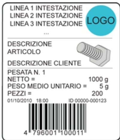
Esempio di etichetta