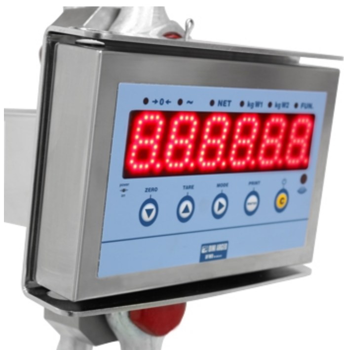
Dinamometro MCW09: display super-luminoso da 40mm