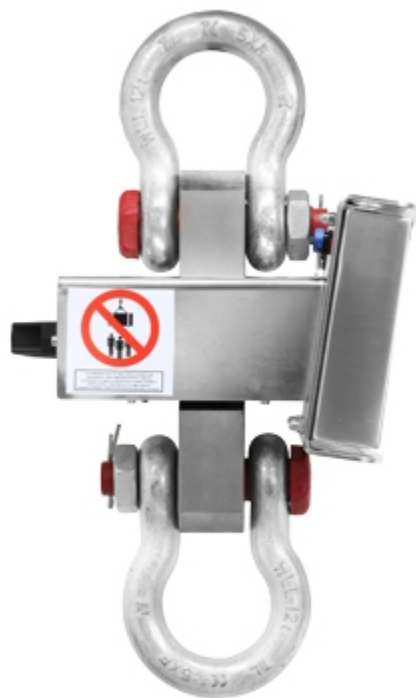
Dinamometro MCW09: vista laterale